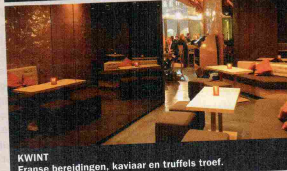
KWINT Franse bereidingen, kaviaar en truffels troef.